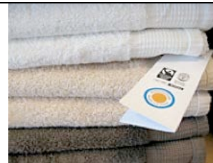
"Clean cotton" håndklær fra Egypt.

Kjøp en bedriftsgave til ansatte, til kunder og til deg selv! Dette er verdens første biodynamiske håndklær fra Egypt – skapt av Sekem i samarbeid med Global-FairTrade. Prosjektet er støttet av Innovasjon Norge og Norad. Det betyr at gaven inneholder en ekstra dimensjon: Stolthet, verdighet og mening, – både for mottaker og produsent! Bli med og ta et aktivt CSR-ansvar og invester i "Clean cotton" håndklær for fremtiden. CSR – Corporate Social Responsibility – fra ord til handling, mer enn veldedighet og sponsing. http://www.sekemscandinavia.com/no_fairtrade_cleancotton.php